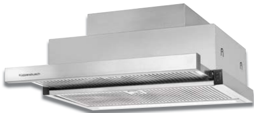
Abbildung mit Griffleiste Zub.-Nr. 6500